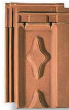
rouge brun R-br