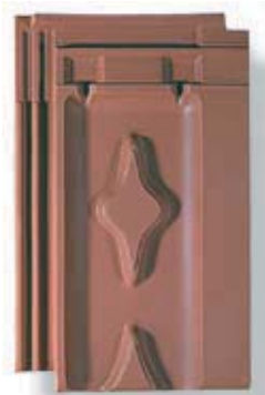
vieilli clair V-cl