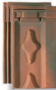
rouge brun flammé brun R-br-fb

En raison de la nature des produits céramiques et des nécessités de leur fabrication, les échantillons ainsi que les photographies ou la documentation en couleurs ne sont remis qu'à titre indicatif, sans garantie de conformité stricte de livraison. Cette réserve est également applicable au cas où les tuiles sont choisies en référence à une toiture existante.