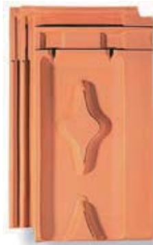
rouge naturel R-na