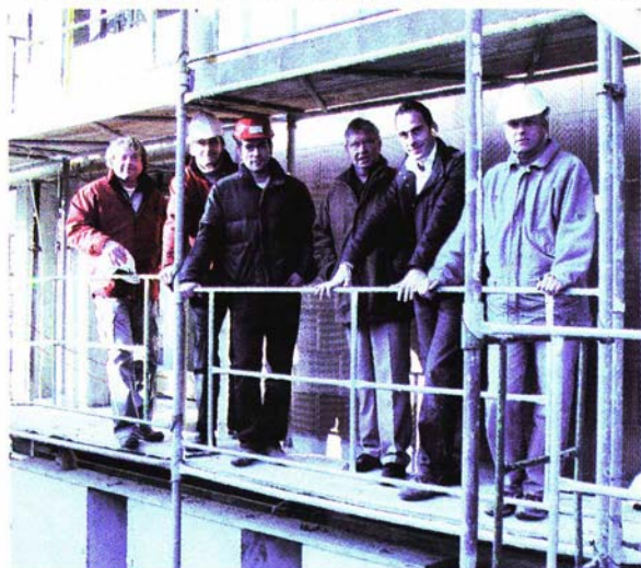
La «révolution» est le fruit de la collaboration entre Alberti Architectes, Rovero Frères et l'entreprise Morandi.

de l'écologie? Pas si vite! Il semblerait que certaines habitudes sont délicates à éliminer. Aussi, peut-être faudra-t-il encore attendre quelque temps pour que la maçonnerie à joints minces s'impose un peu partout et connaisse le succès obtenu en France ou en Allemagne. Mais l'on peut désormais s'attendre à ce qu'à terme, nos maisons ne soient plus jamais les mêmes! R.Po. ■